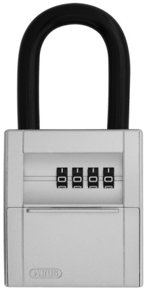
Abb. / fig. / schéma / afb. / ill. 1