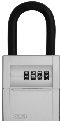
Abb. / fig. / schéma / afb. / ill. 4