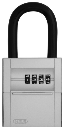
Abb. / fig. / schéma / afb. / ill. 3